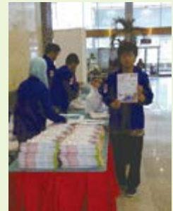
JASSO主催「日本留学フェア」 ジャカルタ会場